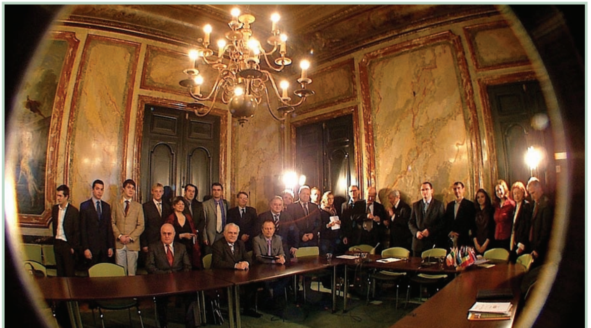
Participanții la Congresul European de la Paris au subliniat necesitatea ca progresul economic să fie în acord cu principiile de dezvoltare durabilă a României